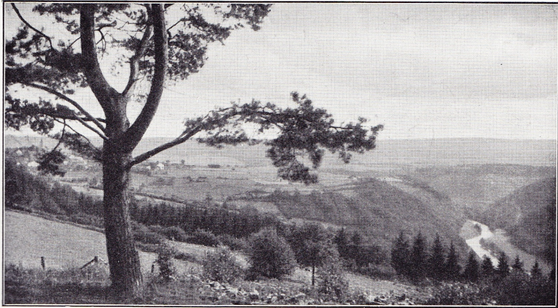
Algemeen zicht op de Amelvallei te Stoumont.