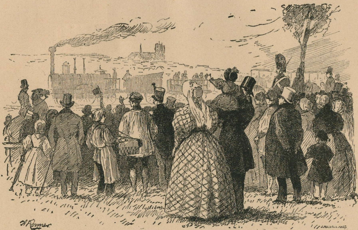
289. — Le premier chemin de fer continental. Inauguration de la section de Bruxelles à Malines, le 5 mai 1835. De eerste spoorweg van het vasteland. Plechtige opening der sectie van Brussel tot Mechelen, den 5 e Mei 1835.