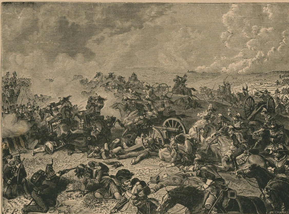
261. — Bataille de Waterloo (18 juin 1815). Le maréchal Ney chargeant à la tête des cuirassiers. Slag bij Waterloo 18 e Juni 1815). Maarschalk Ney aan het hoofd der kurassiers.