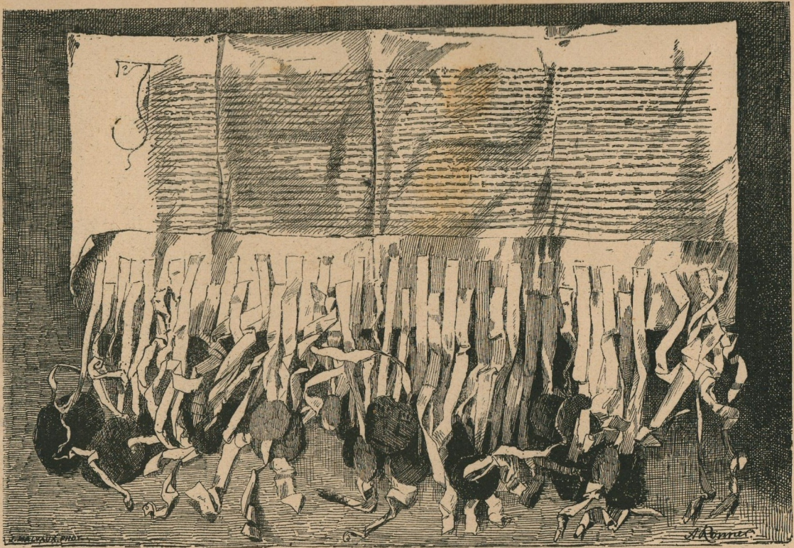
122. — Charte de Cortenberg. Keure van Cortenberg.