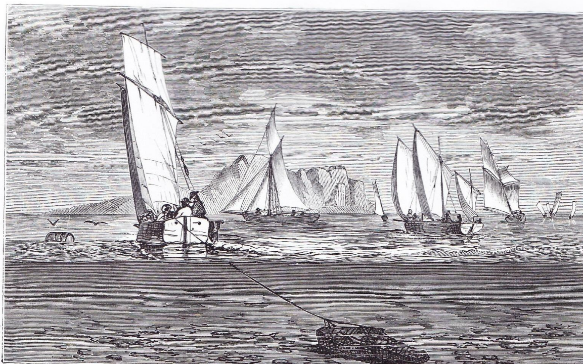
PÊCHE DE L'HUÎTRE.