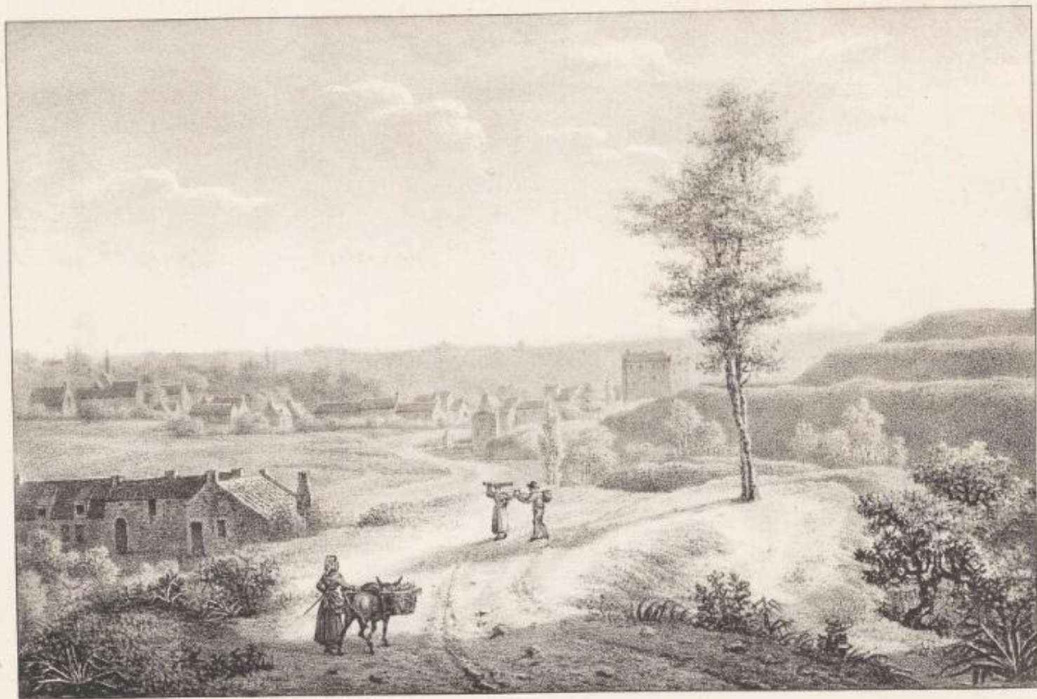
Vue de St Gilles faubourg de Sironcelles