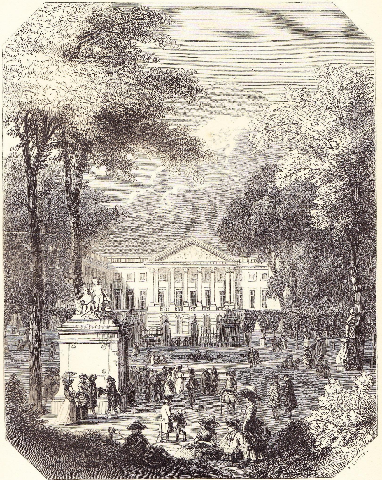
Le Parc, à Bruxelles.