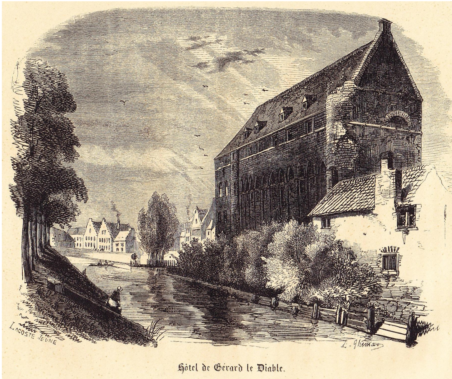
Hôtel de Gérard le Diable.