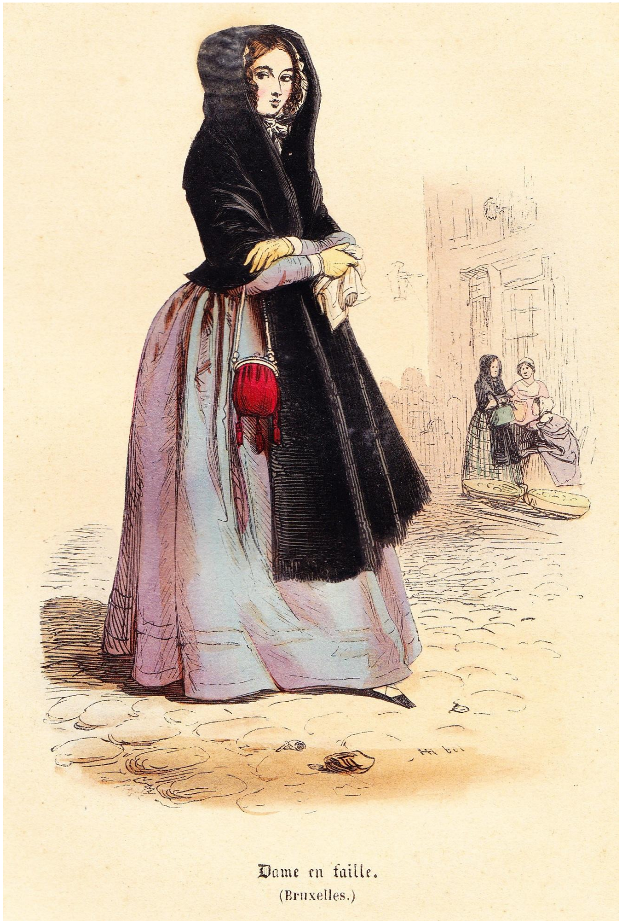
Dame en faille. (Bruxelles.)