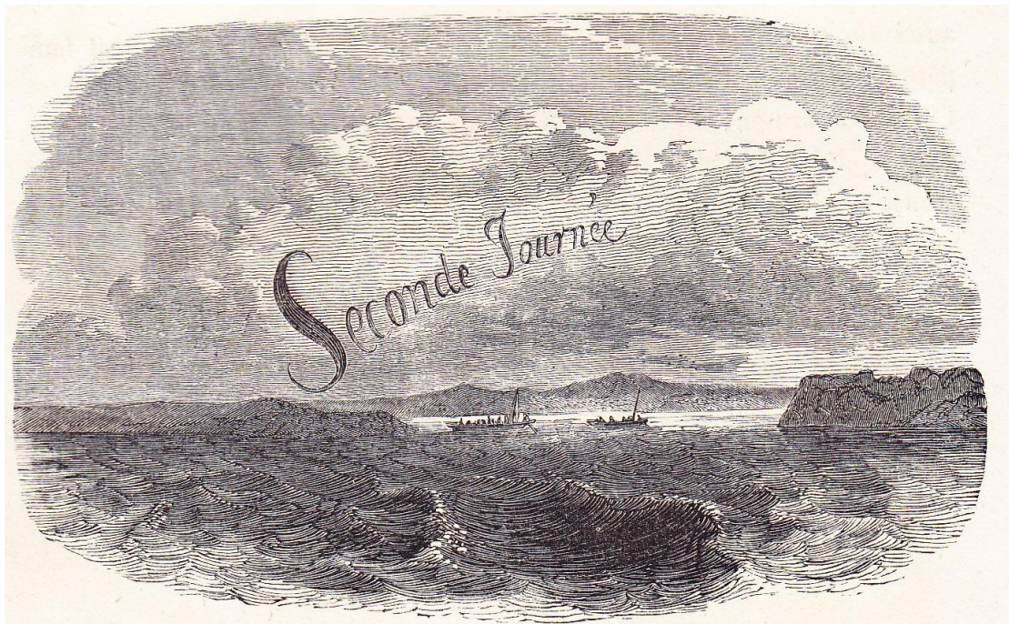
LE LAC BOURGET.