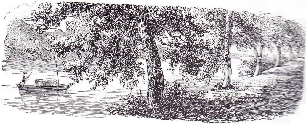
RIVE DE BAVENO