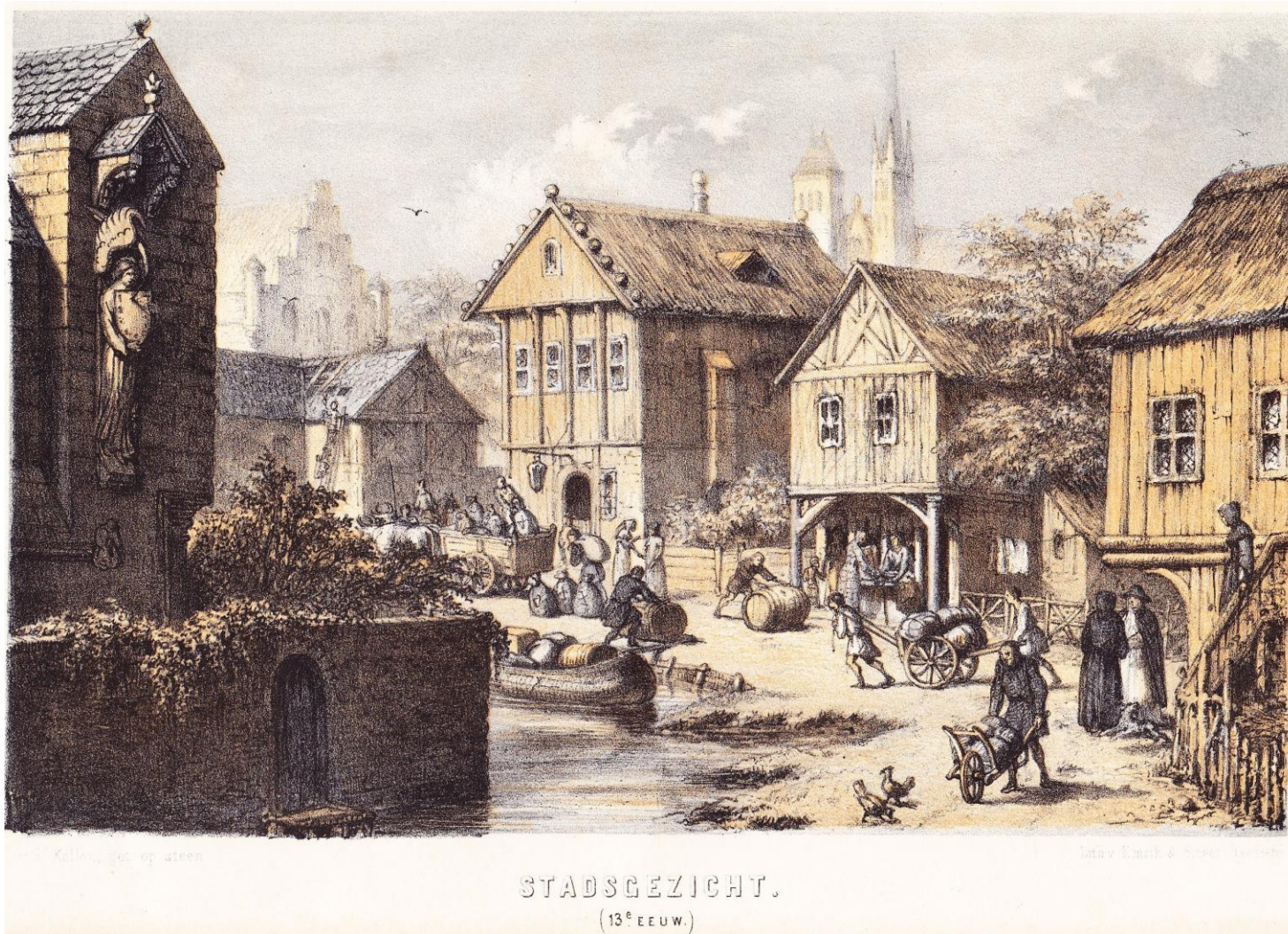
Stadsgezicht (13 e eeuw) » (« Scène urbaine du 13 ème siècle ») in Ons voorgeslacht , vierde deel (eerste druk, 1862), tussen bladzijden / entre pages 72-73.