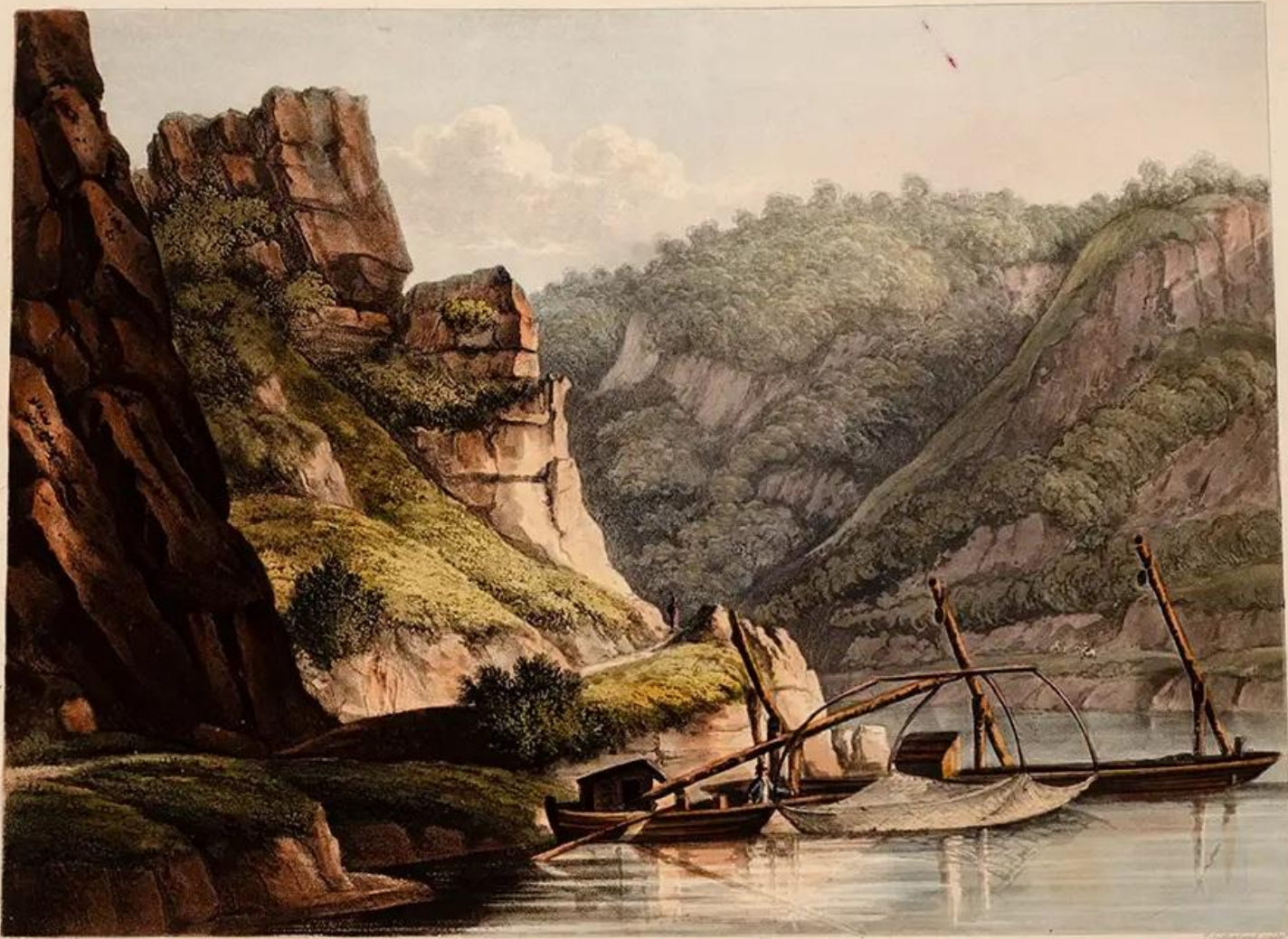
SALMON FISHERY. at Lurley.

Printed and Published by W. & A. G. & Co. Edinburgh, 1820.