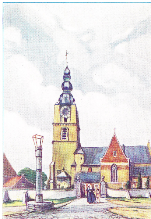
PERRONS EN SCHANDPALEN 4. DE SCHANDPAAL TE MESPELARE