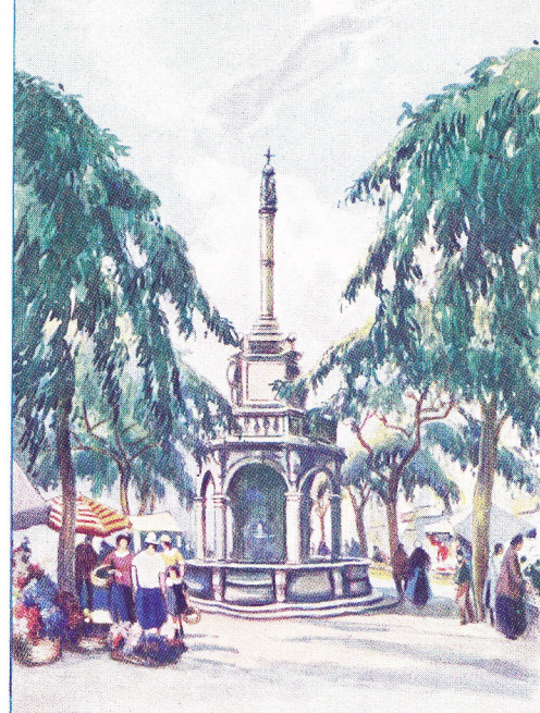
PERRONS EN SCHANDPALEN 1. HET PERRON VAN LUIK