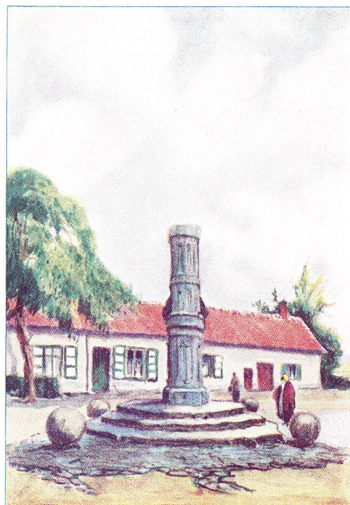
PERRONS EN SCHANDPALEN 6. DE SCHANDPAAL TE VORSELAAR