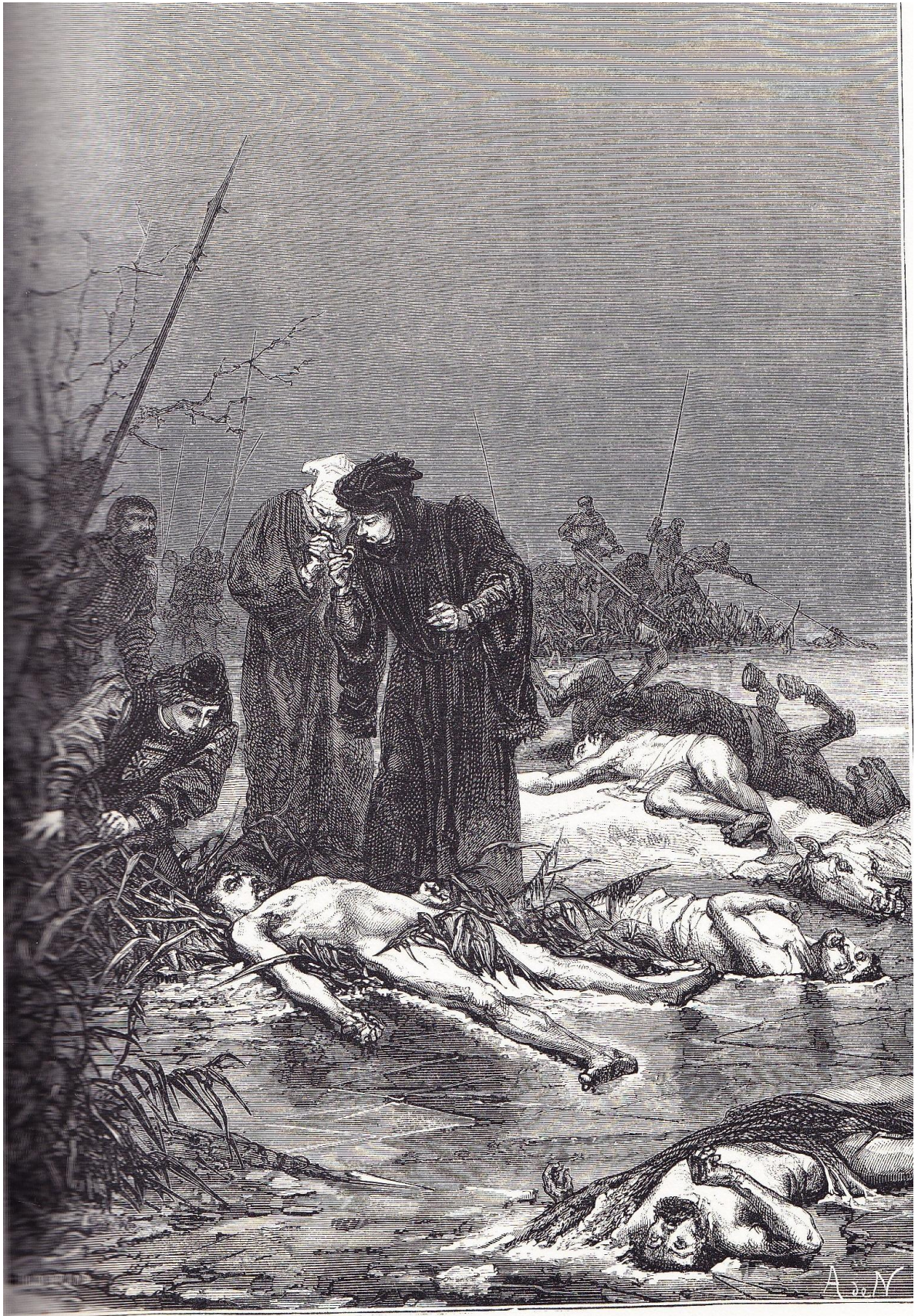
DÉCOUVERTE DU CADAVRE DE CHARLES LE TÊMÉRAIRE

« découverte du cadavre de Charles le Téméraire »