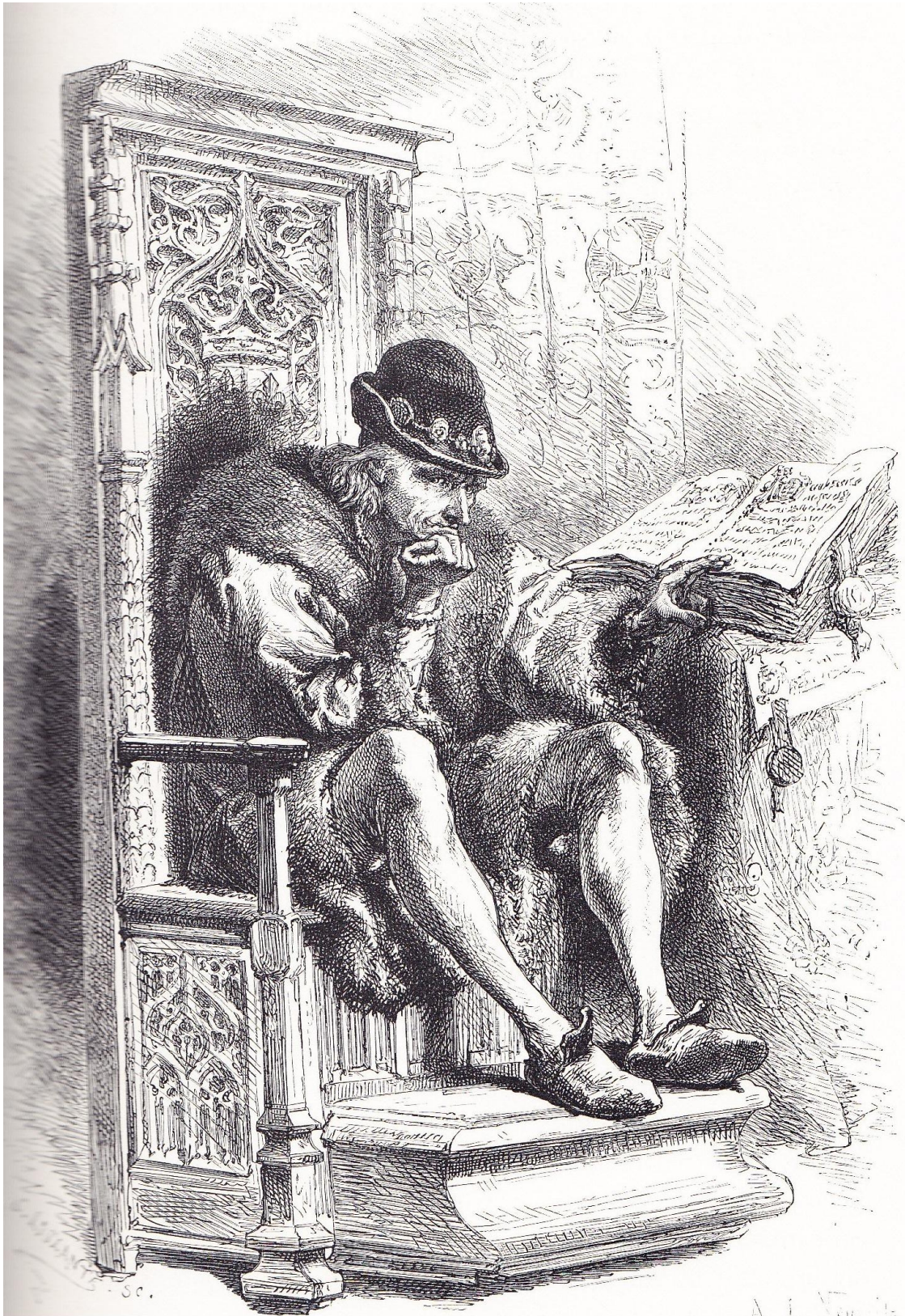
PORTRAIT DE LOUIS XI.