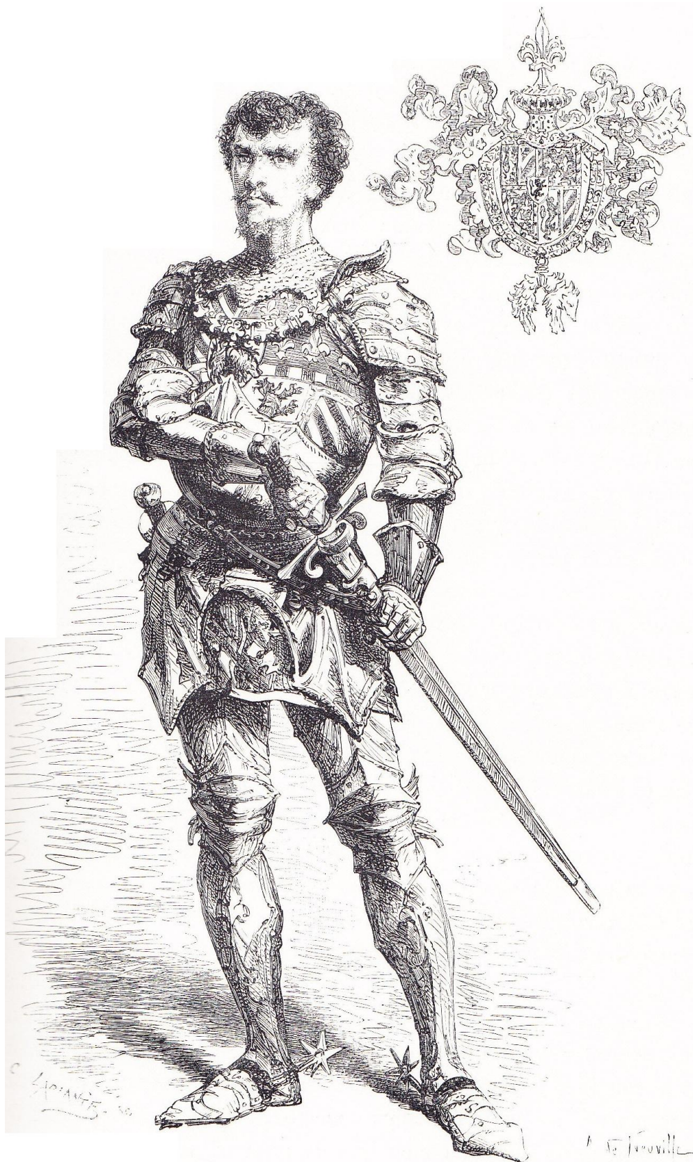
PORTRAIT DE CHARLES LE TÉMÉRAIRE.