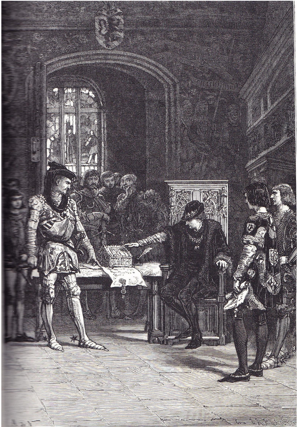
ENTREVUE DE LOUIS XI ET DE CHARLES LE TÊMÉRAIRE A PÉRONNE.

« Entrevue de Louis XI et Charles le Téméraire à Péronne »