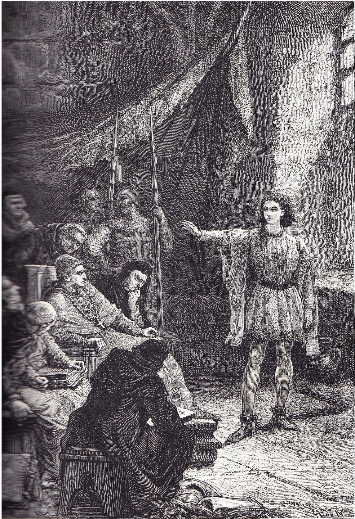
JEANNE D'ARC INTERROGÉE DANS SA PRISON.

« Jeanne d'Arc interrogée dans sa prison »