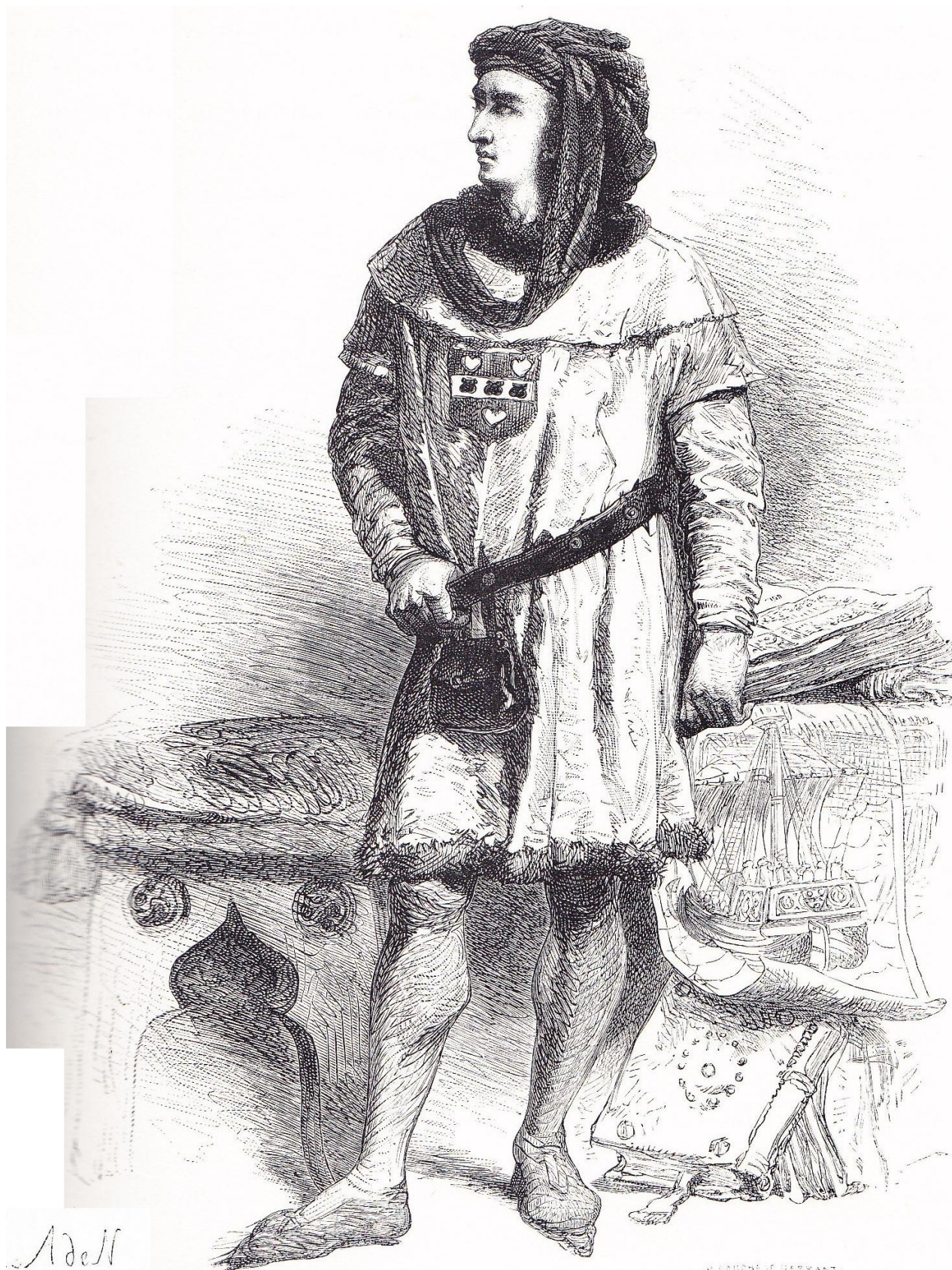
PORTRAIT DE JACQUES CŒUR.