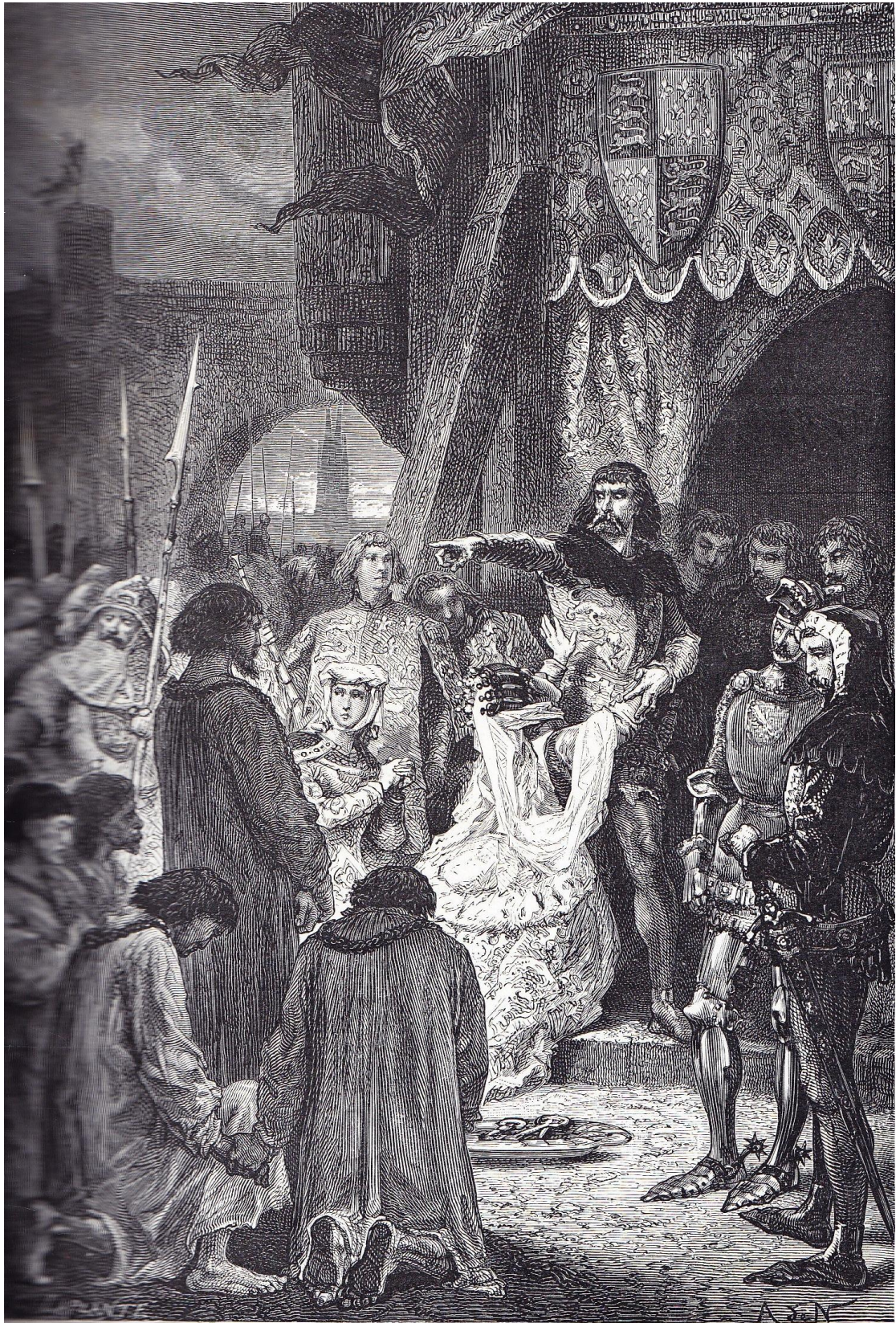
LORS, LA NOBLE REINE SE JETA A GENOUX AUX PIEDS DU ROI

« Lors, la noble reine se jeta à genoux aux pieds du roi »