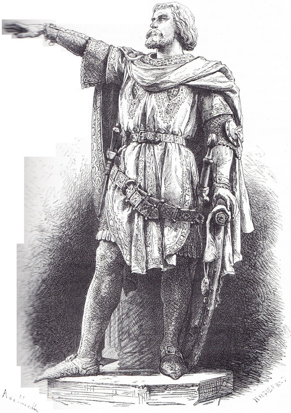
JACQUES D'ARTEVELDE, D'APRÈS LA STATUE SITUÉE SUR LA PLACE DE GAND

« Jacques d'Artevelde d'après la statue située sur la place de Gand »