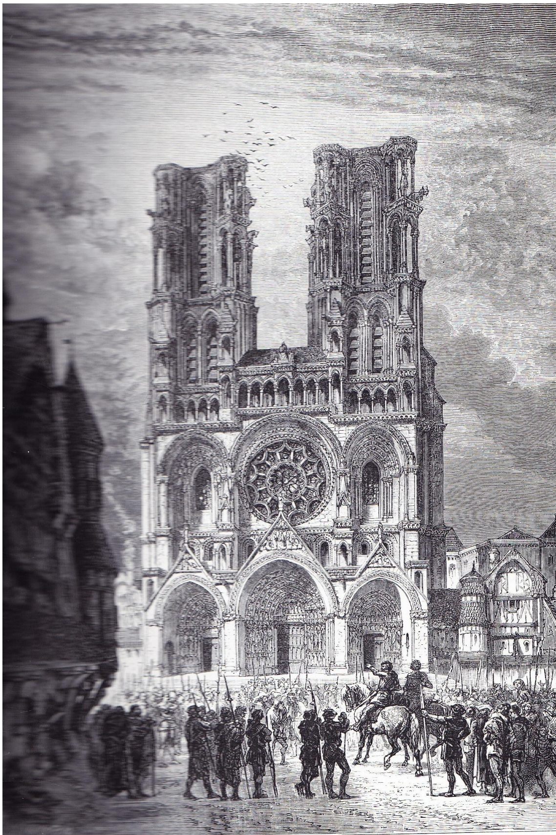
CATHÉDRALE DE LAON