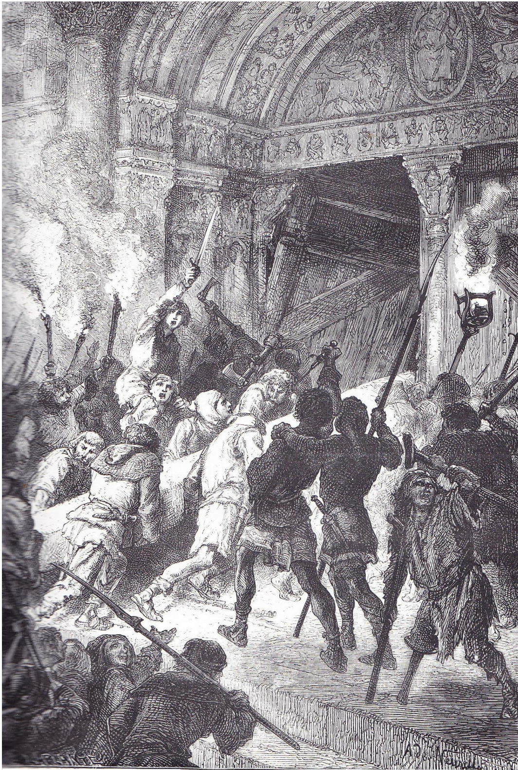
INSURRECTION DES BOURGEOIS DE CAMBRAI CONTRE LEUR ÉVÊQUE ET POUR L'ÉTABLISSEMENT DE LA COMMUNE.

« insurrection des bourgeois de Cambrai contre leur évêque et pour l'établissement de la commune »