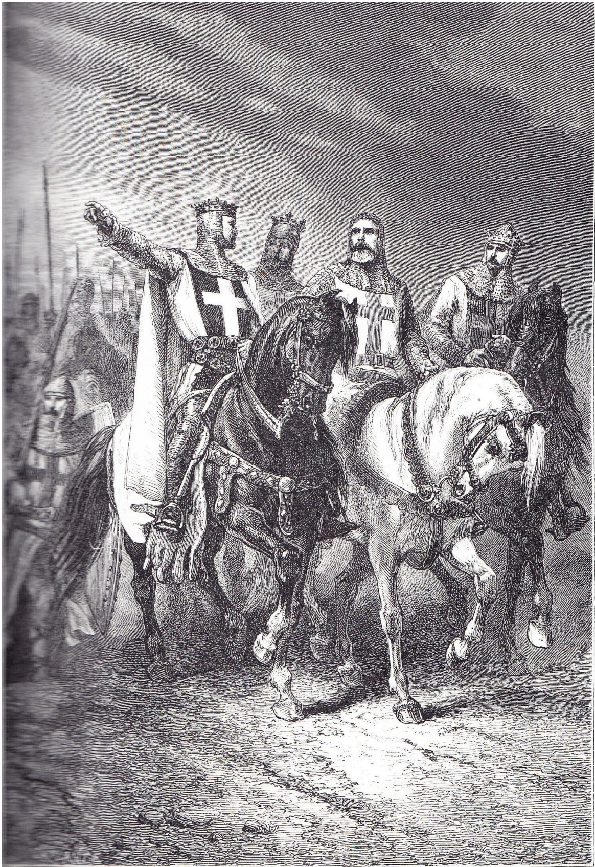
LES QUATRE CHEFS DE LA PREMIÈRE CROISADE

« les quatre chefs de la première croisade »