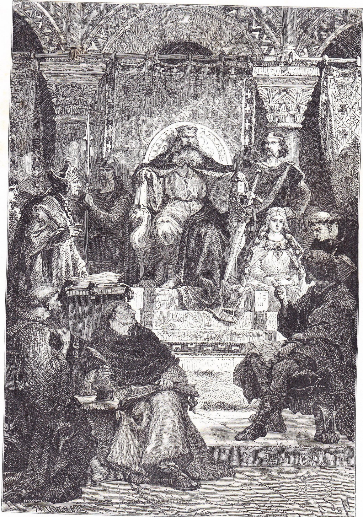
CHARLEMAGNE PRÉSIDENT L'ACADÉMIE DU PALAIS, P. 228

« Charlemagne président l'académie du palais »