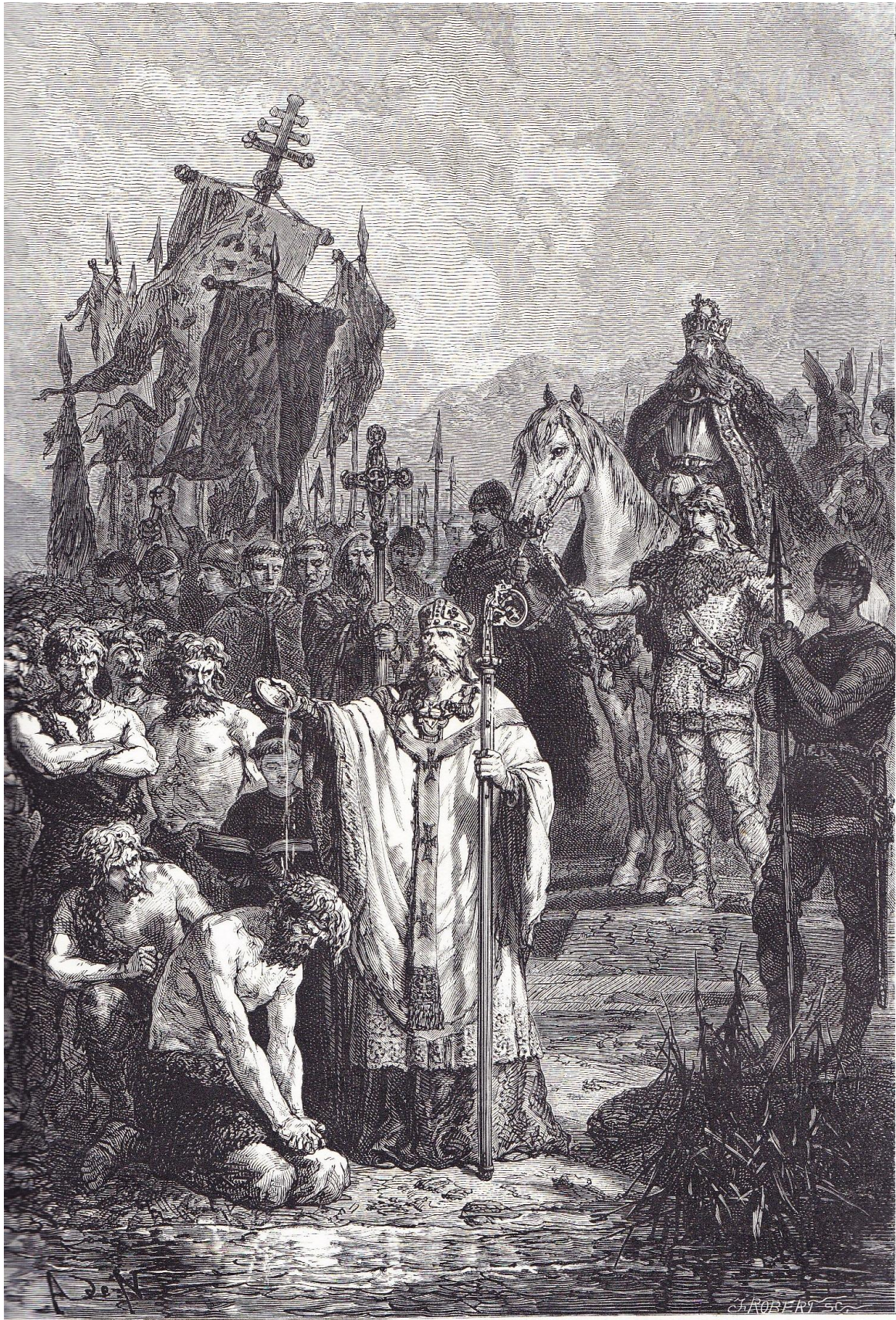
CHARLEMAGNE IMPOSE LE BAPTÊME AUX SAXONS

« Charlemagne impose le baptême aux saxons »