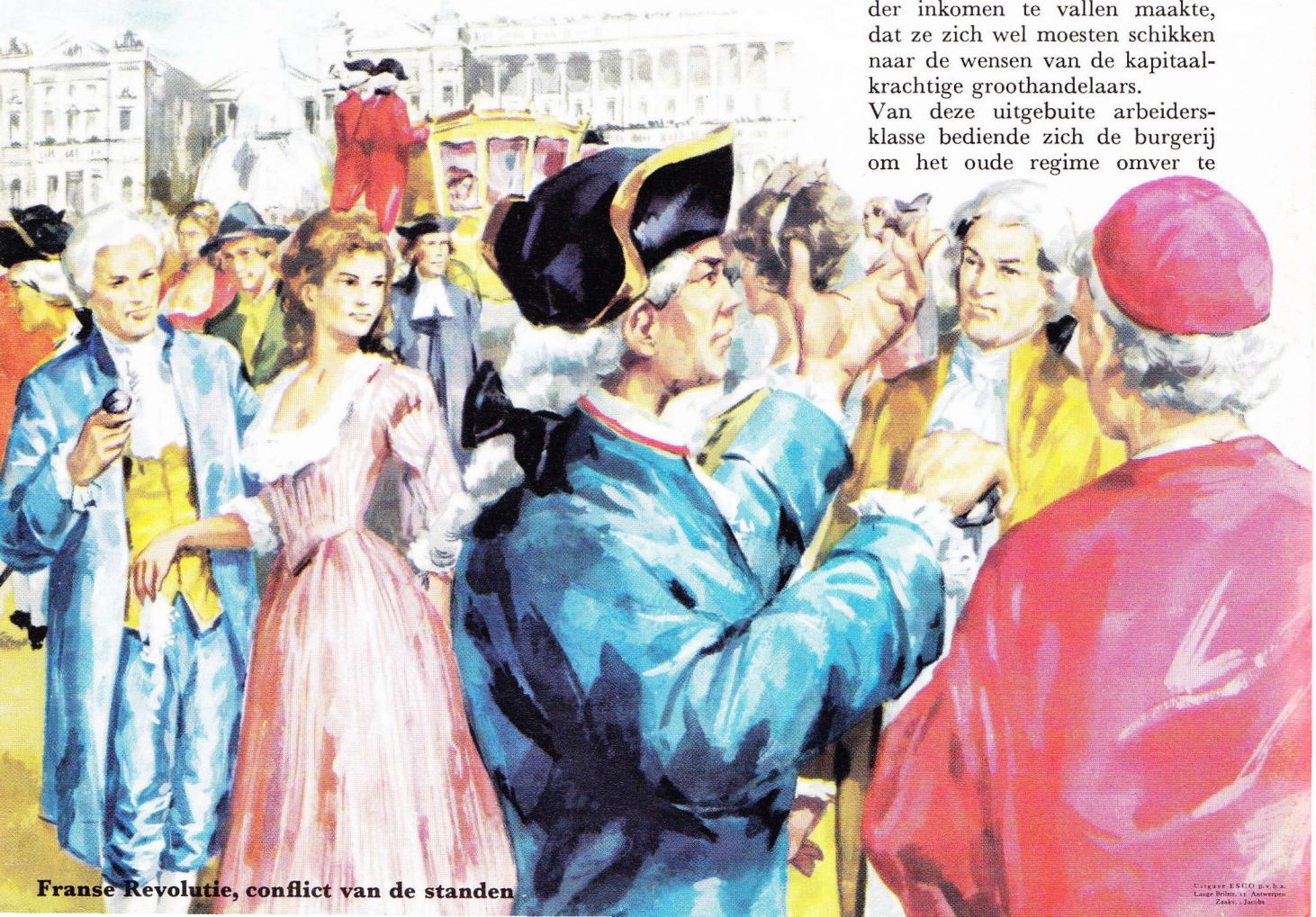
Franse Revolutie, conflict van de standen

Van deze uitgebuide arbeidersklasse bediende zich de burgerij om het oude regime omver te