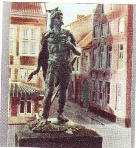
No. 438. Standbeeld van Ambiorix te Tongeren