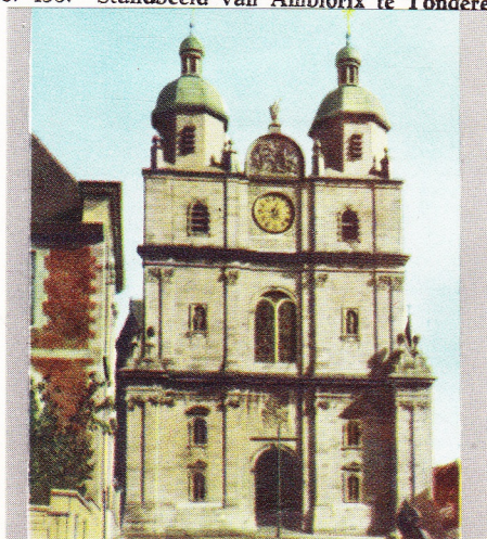
No. 440. Kathedraal van St. Hubert