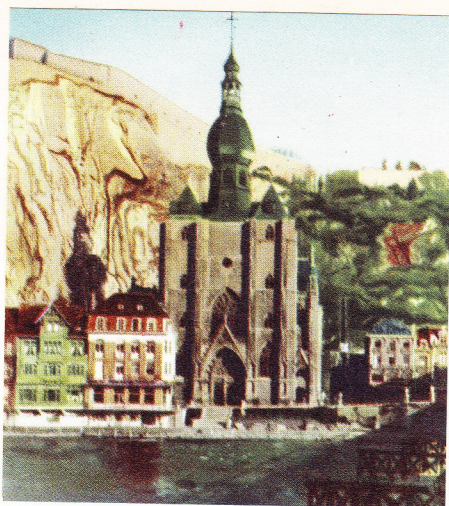
No. 436. O. L. Vrouwkerk te Dinant