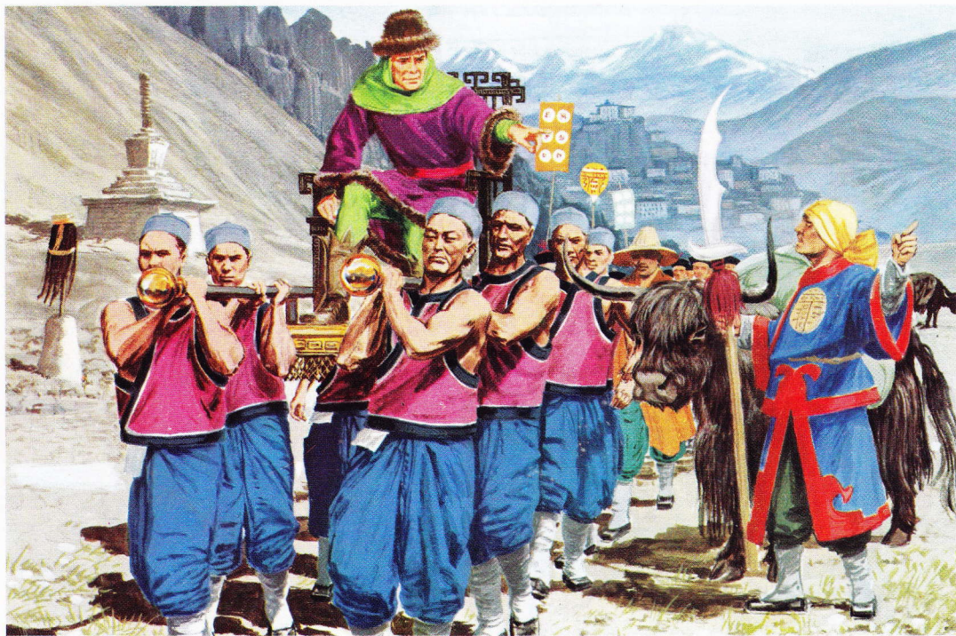
Marco Polo a vraisemblablement voyagé jusqu'au Thibet sur ordre de Koublai-Khan.

Les amis, les parents et les voisins se précipitèrent alors pour regarder les revenants avec étonnement. Ils avaient quitté Venise 27 ans plus tôt : c'était comme s'ils