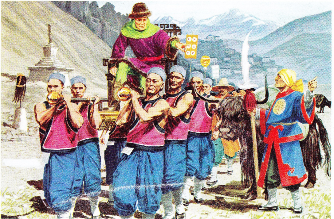
Waarschijnlijk reisde Marco Polo in opdracht van de Kublai Kan naar Tibet.

Vrienden, familieleden en burens stroomden toe om de vermisten te begroeten. 27 jaar geleden hadden zij Venetië verlaten. Het leek alsof ze uit het graf waren ver-