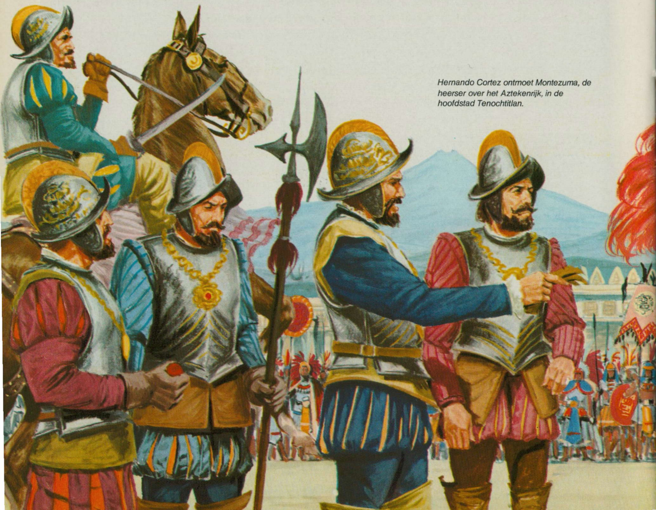
Hernando Cortez ontmoet Montezuma, de heerser over het Aztekenrijk, in de hoofdstad Tenochtitlan.

Maar Cortez wou precies het tegenovergestelde.