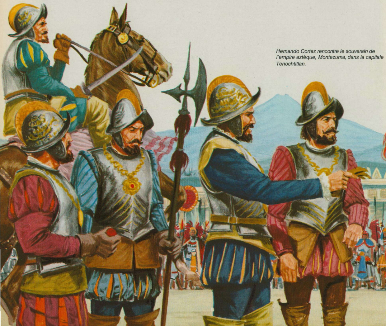
Hernando Cortez rencontre le souverain de l'empire aztèque, Montezuma, dans la capitale Tenochtitlan.