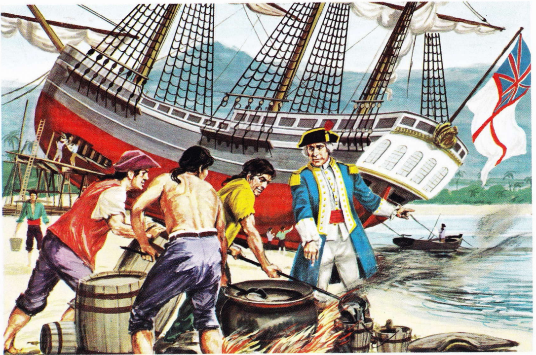
On répare "l'Endeavour", endommagé au milieu du Pacifique.

Tout était déjà prêt pour le départ et le dernier des canots allait quitter la plage, quand une centaine d'indigènes, postés en embuscade, s'élancèrent à l'assaut. Cook voulut éviter un combat qui lui semblait absolument insensé, mais le canot fut intercepté. Cook sauta à l'eau, l'épée au poing, afin de défendre ses hommes désarmés. Grièvement blessé, il donna l'ordre de ramer au plus vite vers le navire. Ses marins étaient réduits au rôle de spectateurs impuissants : le grand capitaine fut abattu à coups de massue. C'était le 14 février 1779.