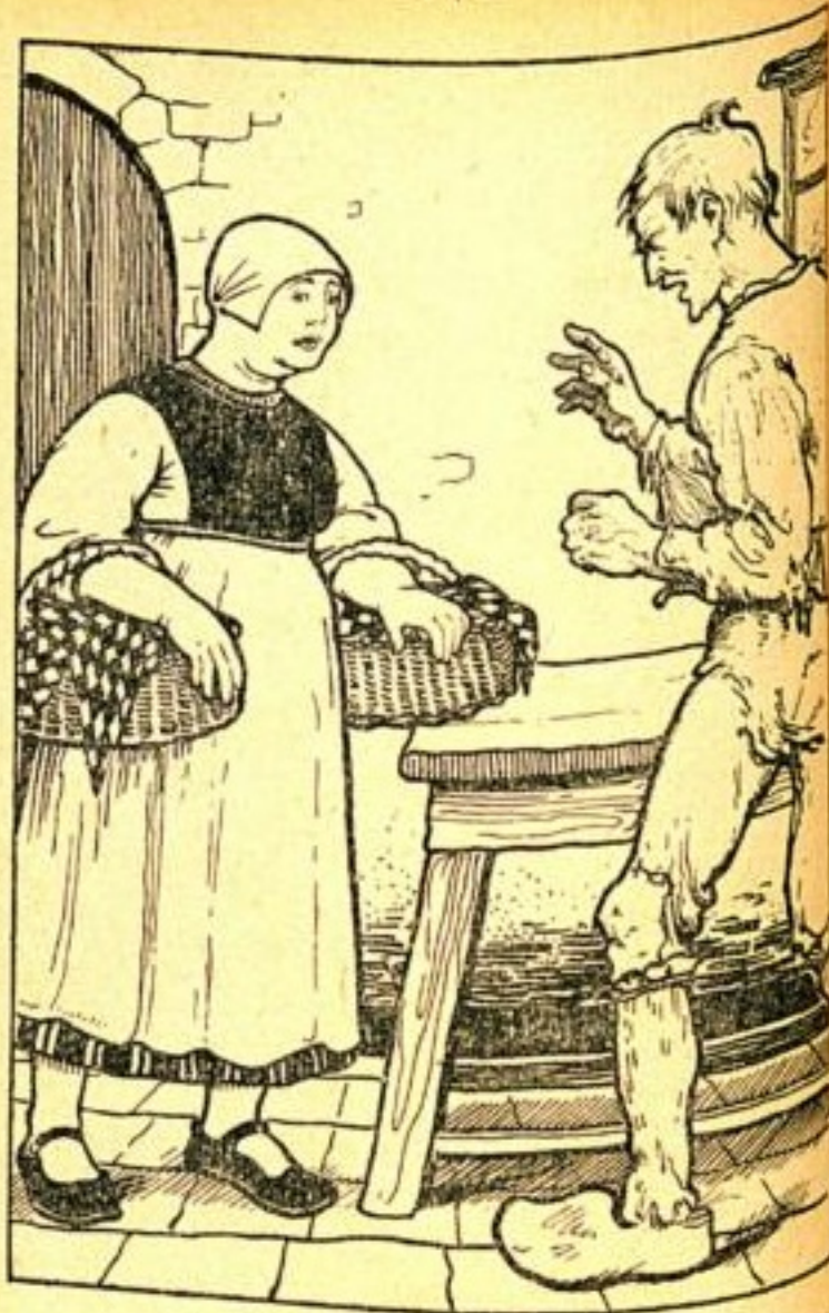
Boer Nork stond zekeren Lentemorgen op de lochting en keek door de groote ronde poort, die wijd openstond, naar buiten en zag

op den hoogen heuvel in de verte de vestingen van Brussel, met de hooge boomen er boven op. Overal groen! In het Zuiden stond de zware massa van het Sonienbosch met zijn leger van groene vlaggen. Links en rechts waren al de fruitboomen in bloei, bergen van bloemen, en het rook op de wereld of er reukten regenden. Nork bevond zich naast een hoogen struik, die vol witte jusemienen stond.