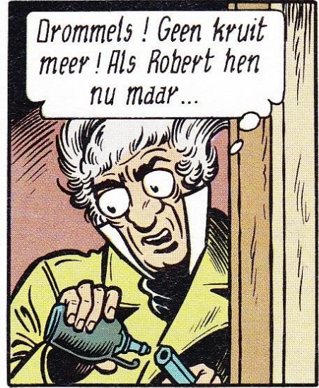
Drommels ! Geen kruut meer ! Als Robert hen nu maar ...