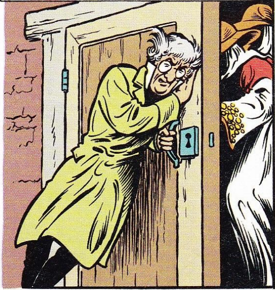
D E SPEURDER TRACHT DE DEUR TE SLUITEN MAAR VOELT HOE ZIJN KRACHTEN AFNEMEN. PLOTS GILT DE VROUW...