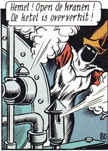
Hemel ! Open de kranen ! De ketel is oververhit !