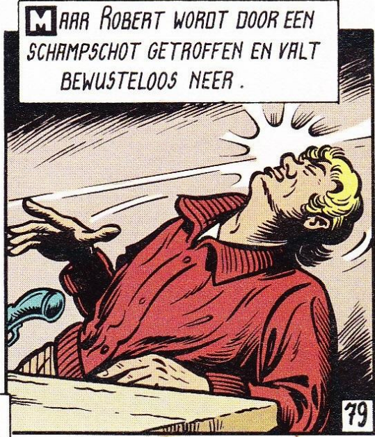
M AAR ROBERT WORDT DOOR EEN SCHAMPSCHOT GETROFFEN EN VALT BEWUSTELOOS NEER .