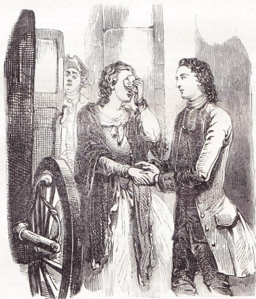
Je vous défends de sortir.

Il s'arrête un moment, puis il s'écrie: « J'ai rempli d'épouvante et d'horreur le cœur d'une femme charmante qu'il était de mon devoir de protéger contre ces emportements et ces violences dont je viens moi-même de la rendre témoin.