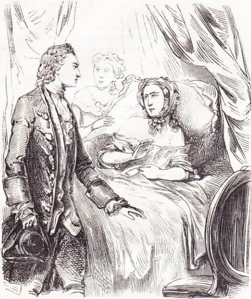
Milord Elmwood chez miss Milner.

Un après-midi qu'elle était dans son cabinet de toilette avec miss Woodley, et que toutes deux gardaient le silence, pour ne pas se dé-