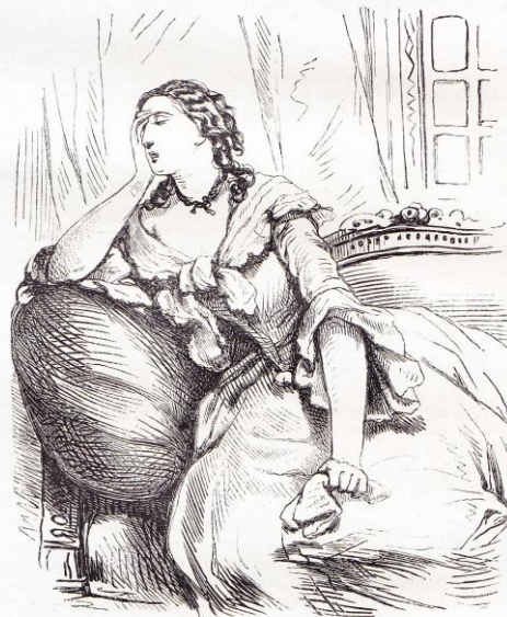
La lettre de milord.

Telles furent ses résolutions, et telles elle les exécuta. Le juge le plus sévère n'aurait pu faire le plus petit reproche à sa fermeté, depuis le moment où elle reçut la lettre de milord Elmwood. Il est bien vrai que, de temps en temps, elle se sentait des retours de faiblesse, mais elle savait aussitôt les combattre, et presque toujours les surmonter.