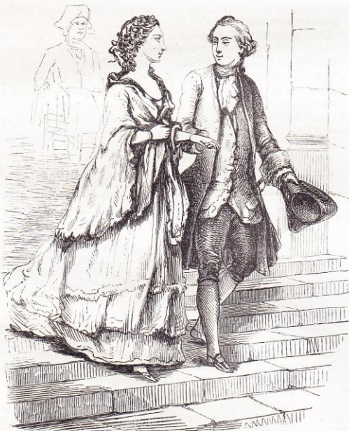
La sortie de l'Opéra.

couvrir mutuellement, l'une les chagrins qu'elle dévorait, l'autre les inquiétudes qui ne cessaient de l'agiter, un des gens de milord Elm-