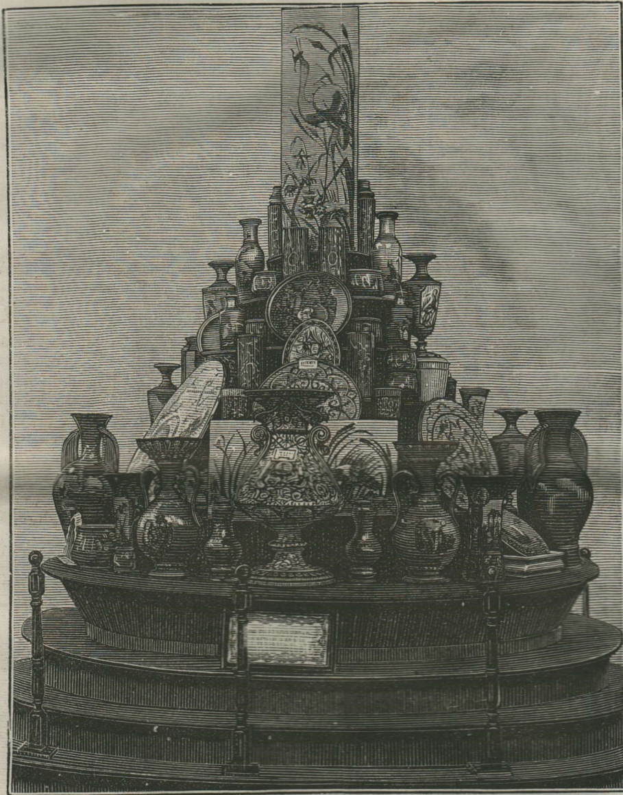
MANUFACTURE DE FAÏENCES-MOUZIN-LECAT ET C ie A NIMY-LEZ-MONS.

Espérons que le projet réussira et que la Hollande aura aussi sa grande Exposition.