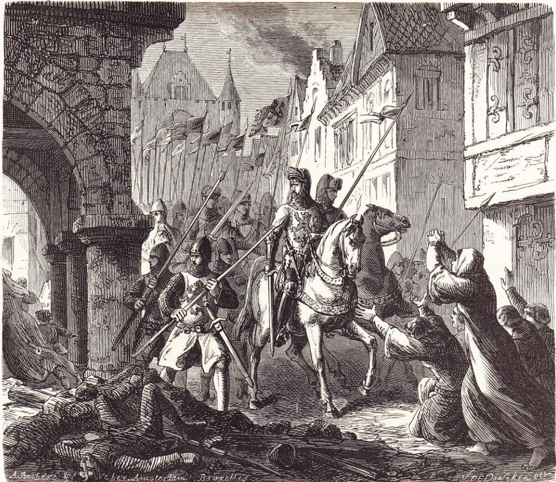
GRAAF LODEWIJK VAN MALE TREKT ALS OVERWINNAAR BRUSSEL BINNEN.

geweest, en Wenceslas, de jongste, had aan de mildheid van zijnen broeder het graafschap Luxemburg, het voorvaderlijk erfdeel, dat voor hem tot hertogdom verheven werd, te danken (1354). Jan III, hertog van Brabant, gaf zijne dochter Johanna, erfgename van zijne opperheerschappij, aan Wenceslas. De uitzet der jonge echtgenooten moest zich dus uitstrekken van de