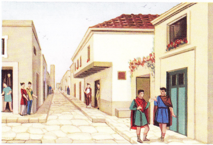
Une rue à Pompei

Caton l'ancien, appelé aussi le censeur parce qu'il exerça impitoyablement la censure contre les grands, était un plébéien resté simple, austère et attaché à la tradition romaine. S'il administra ses biens avec économie, s'il fut âpre au gain et rude pour les esclaves qu'il conseillait de traiter comme des choses, il servit aussi son pays avec zèle. Effrayé par la corruption croissante qui envahissait Rome, Caton tenta de réagir par des mesures légales. S'attaquant à la rapacité des généraux et des gouverneurs