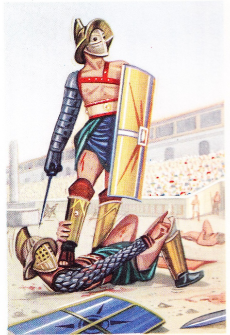
Combat de Gladiateurs

Administration des provinces. Le proconsul, assisté de légats et d'un questeur, gouvernait la province romaine.