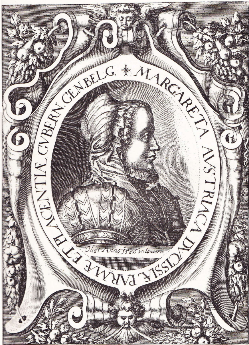
PORTRAIT DE MARGUERITE DE PARME