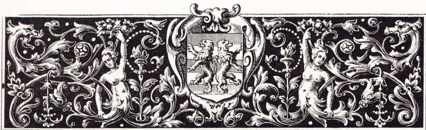
ARMOIRES DE LA VILLE D'AUDENARDE