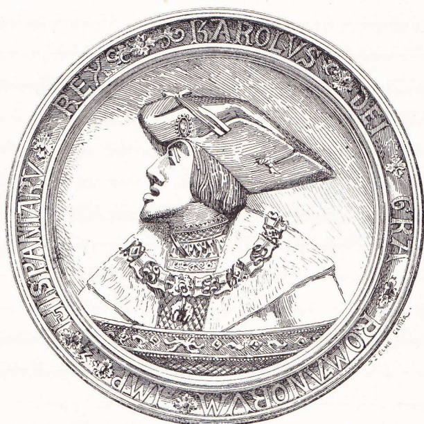
PORTRAIT DE CHARLES-QUINT DANS SA JEUNESSE