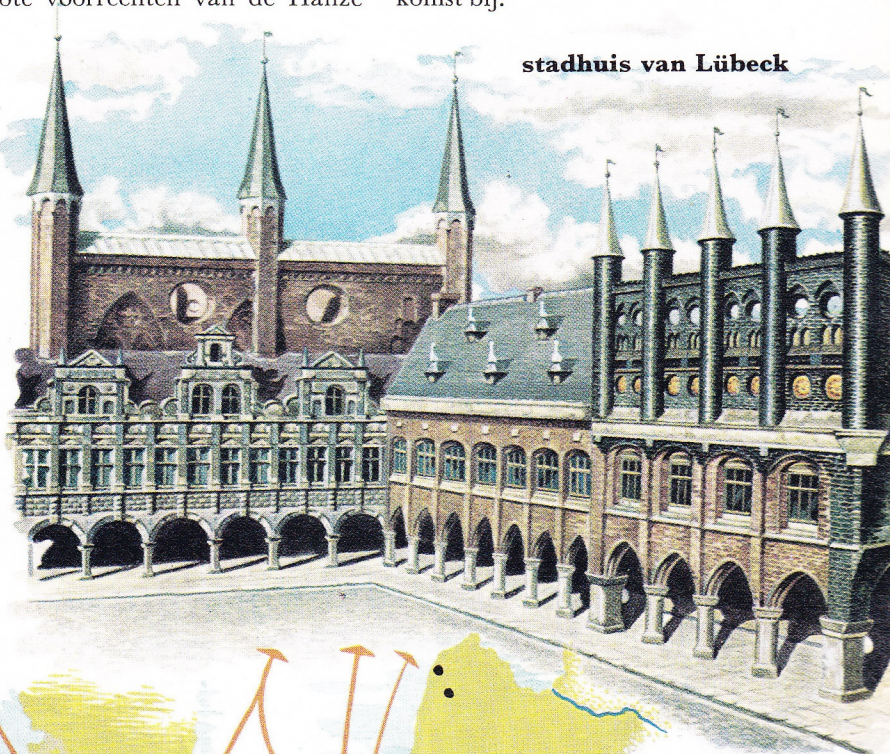
stadhuis van Lübeck

beknot. Ze verloor vele privileges en in 1494 werden de kantoren te Nowgorod, in 1598 te Londen, door de plaatselijke overheid gesloten. Engelsen en Hollanders werden steeds grotere mededingers van de Hanze, zodat de kantoren in verval geraakten. Brugge werd er in de 15e eeuw ook het slachtoffer van: de Hanzeaten gaven er weldra de voorkeur aan met jonge, opkomende steden handel te drijven, o.m. met Antwerpen en Amsterdam. Meer en meer steden verlieten het verbond: in 1669 woonden slechts zes steden de laatste Hanzebijeenkomst bij.