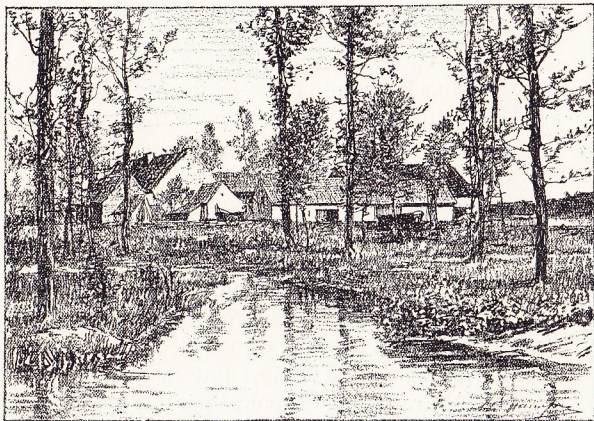
Ferme à Oosthoek (Ternath).

pointe vers Ternath : il y a une heure de marche de Bodeghem-Gare à Ternath-Station. Voici un petit itinéraire que nous conseillons : Nous traversons la voie ferrée, et au bout de quelques pas, notre route s'arrêtant à une autre route transver-