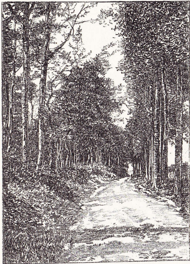
La Lisière du Rond enbosch à Bodeghem-Saint-Martin.

bouteille et des verres peints sur la façade et par cette enseigne : Au Bienvenu .