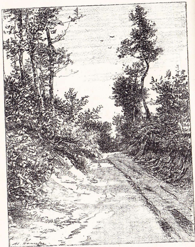
Chemin à Alseberg près du cabaret « In den Keyzer ».

admirons à droite une vue générale de la forêt de Soignes, la petite et la grande Espinette.