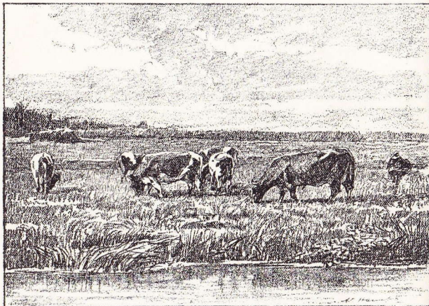
Pâturage à Rhode-Saint-Genèse.

Au bout de dix minutes de marche, nous voyons