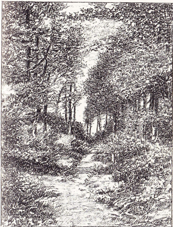
Sous-Bois à Stockel.

Voici un petit itinéraire des plus intéressants. Dirigeons-nous jusqu'à l'entrée du parc royal et au lieu d'entrer tournons à droite. Nous descendons une petite rue et nous aboutissons aux étangs, qui sont d'une sauvagerie superbe. De ce point, le panorama est fort beau. A droite, tout le village que nous dominons; à gauche, la propriété de Robiano; et à l'angle de celle-ci, en face du château et du même côté, la drève de charmes qui longe notre chemin. C'est ce site que feu Hippolyte Boulanger a reproduit dans le chef-