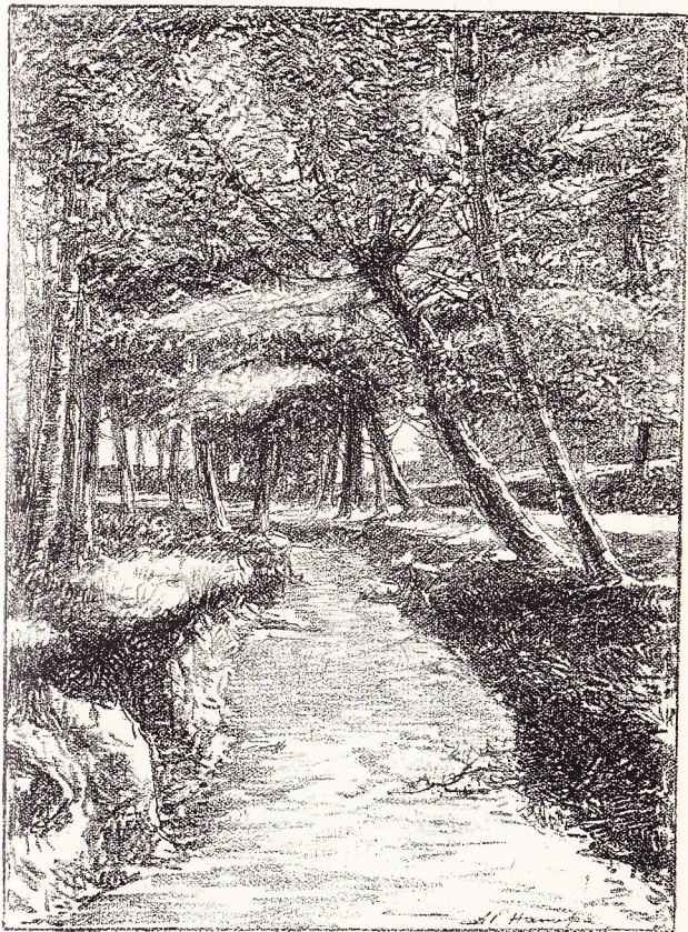
Le Ruisseau à Oeyenbrugge.

A Grimberghen, où nous retrouvons le tramway