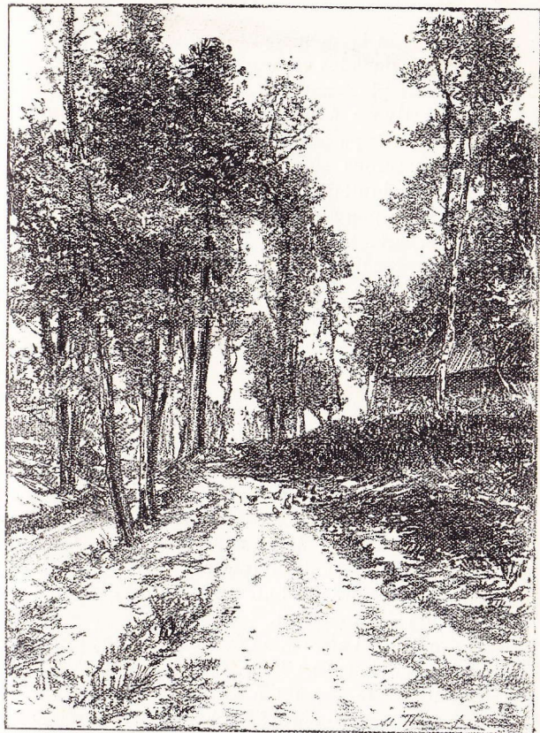
Le Chemin du ruisseau, entre Epeghem et Pont-Brûlé.

Nous montons le chemin qui longe le ruisseau :