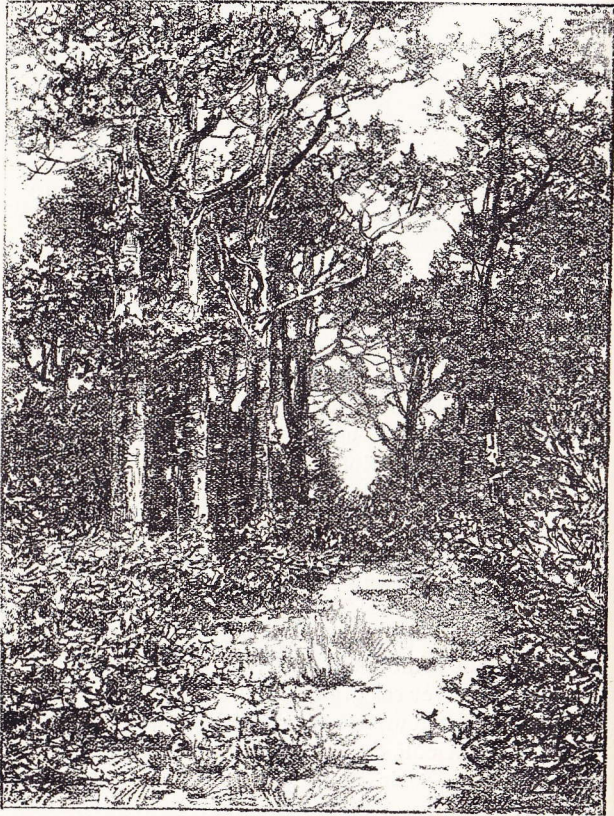
Les Chênes du bois de Rixensart.