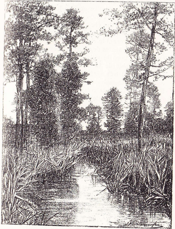
La Lasne à Rosières.