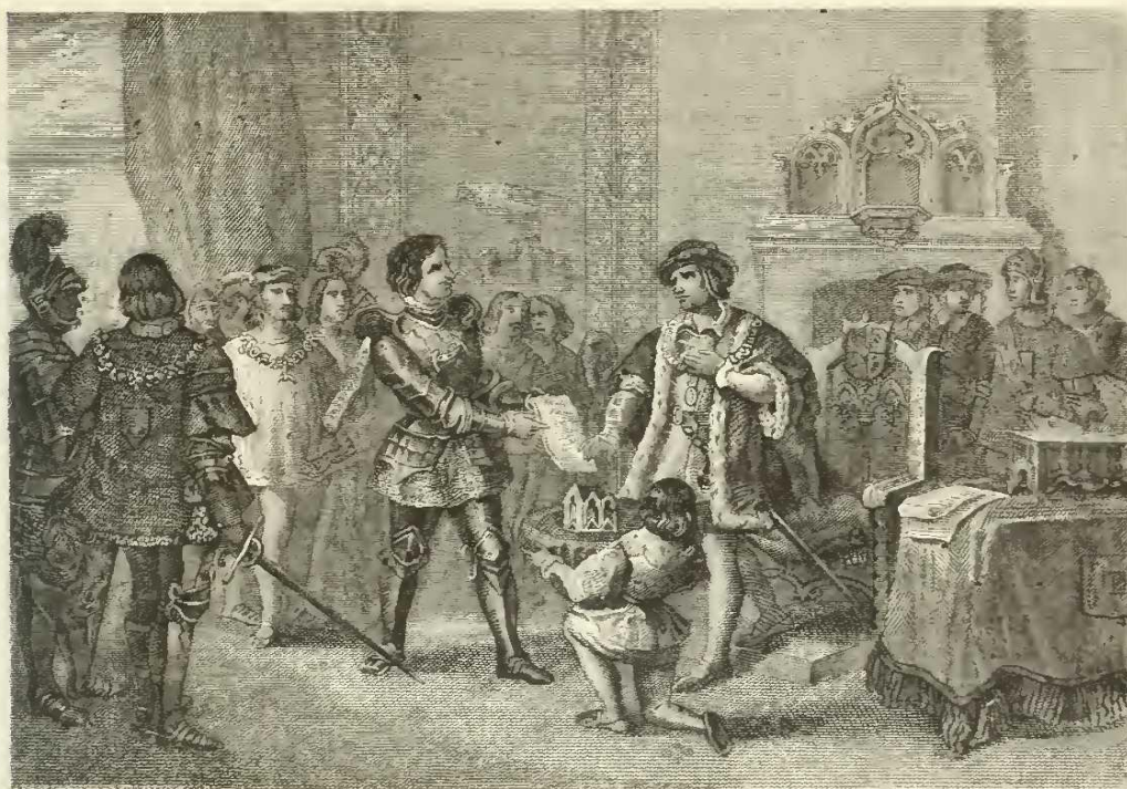
Louis XI à Péronne.

Louis XI, bien honteux, non pas d'avoir trahi et livré à la destruction ses alliés, mais d'avoir été pris pour dupe, n'osa rentrer à Paris, de peur des moqueries des Parisiens, qui disaient que le renard s'était laissé prendre par le loup. Il s'en retourna dans ses châteaux de la Loire.