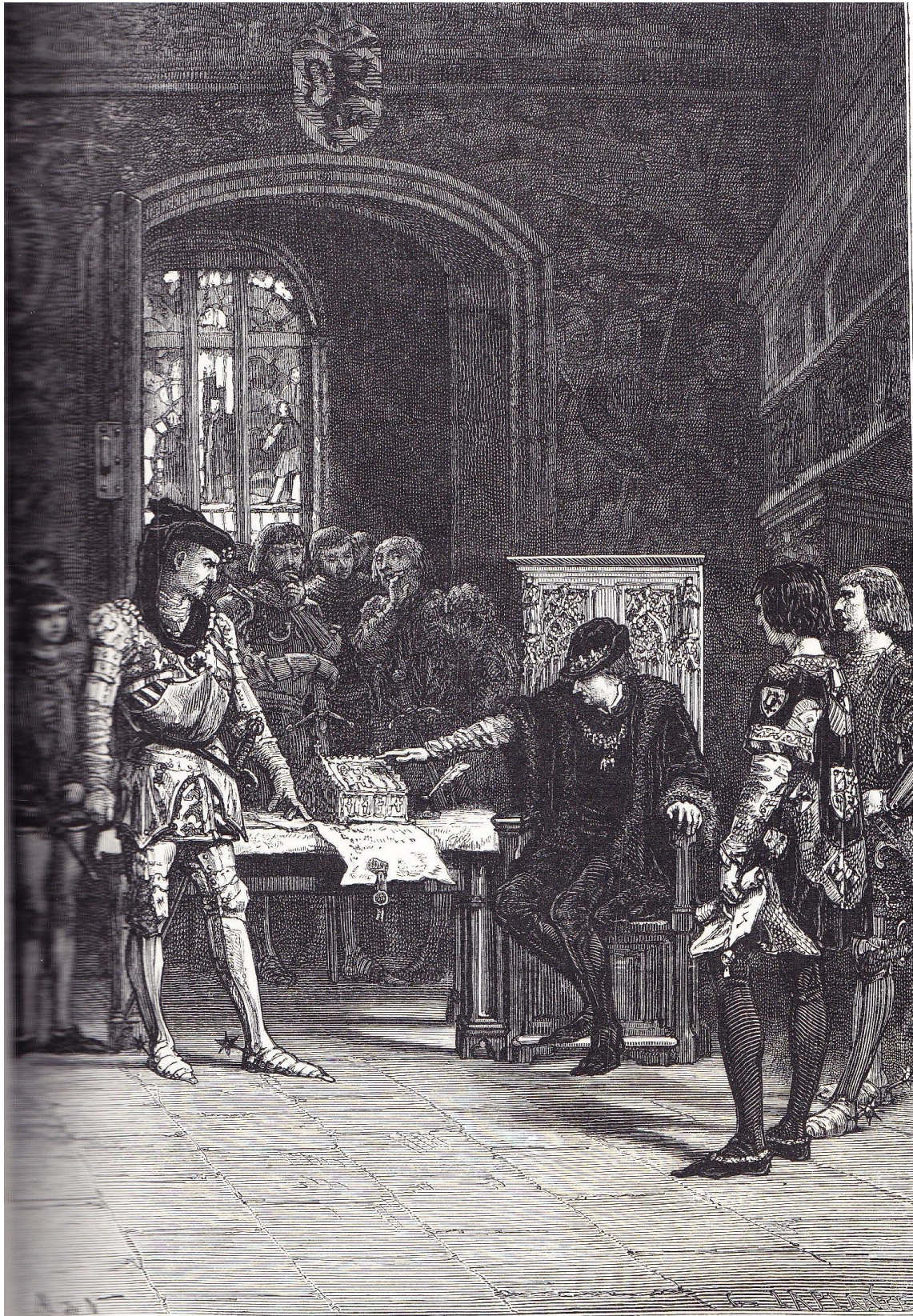
ENTREVUE DE LOUIS XI ET DE CHARLES LE TÉMÉRAIRE A PÉRONNE.

F. GUIZOT , L'histoire de France ... à la page 401 (tome second , 1873)