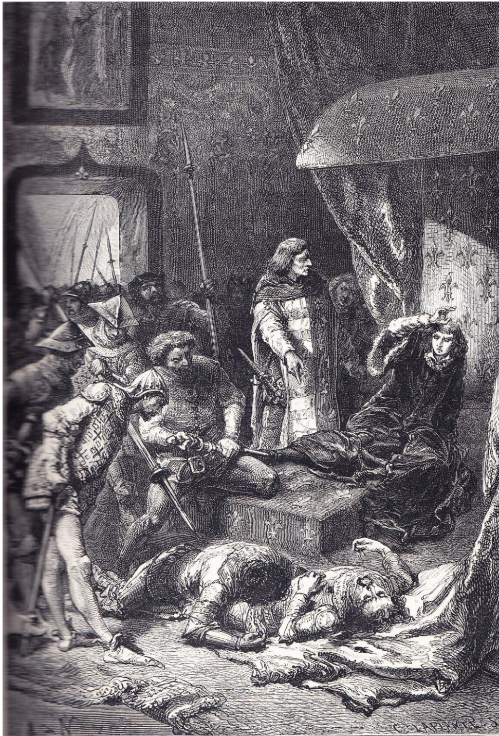
MASSACRE DES MARÉCHAUX

« massacre des maréchaux » (sous les yeux du dauphin Charles V, 22 février 1358) F. GUIZOT , L'histoire de France ... à la page 1 (tome second , 1873)