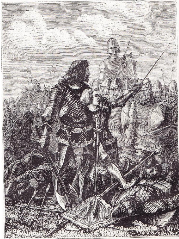
Le roi Jean à Poitiers.

à table, comme un vassal servait son seigneur (19 septembre 1356).