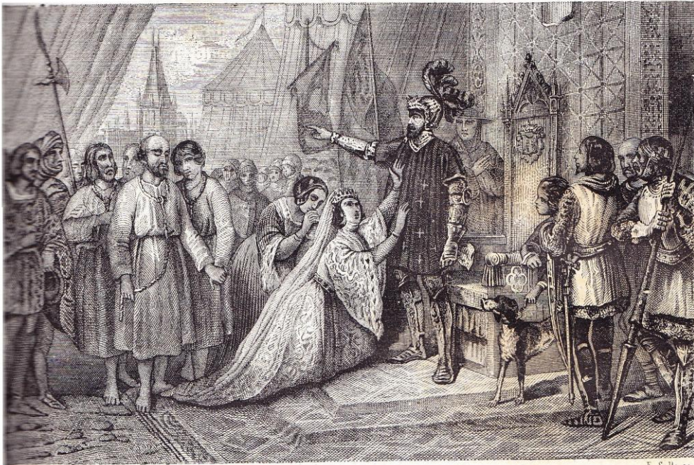
Les bourgeois de Calais.

chevaliers de le mener au plus fort de la mêlée. Ils lièrent ensemble tous les freins de leurs chevaux, pour ne point se séparer de leur roi ni les uns des autres, et ils allèrent si avant que, le lendemain, on les trouva tous morts ensemble, et leur roi au milieu d'eux.