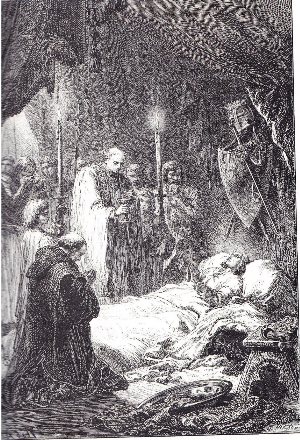
MORT DE SAINT LOUIS

« mort de saint Louis », F. GUIZOT , L'histoire de France ... à la page 443 (1872)