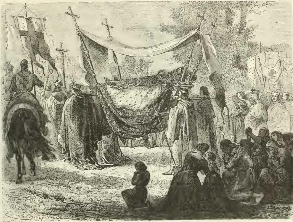
Funérailles de saint Louis.

son fils aîné, appelé Louis; le second, Philippe, étant maintenant l'héritier du trône, saint Louis légua au troisième, Tristan, le comté de Valois; au quatrième, Pierre, les comtés d'Alençon et du Perche; au cinquième, Robert, le petit comté de Clermont en Beauvaisis. Ce comte Robert de Clermont, devenu seigneur de Bourbon par son mariage avec l'héritière de cette riche seigneurie, fut la tige de la maison de Bourbon, qui a fait si grande figure dans l'histoire.