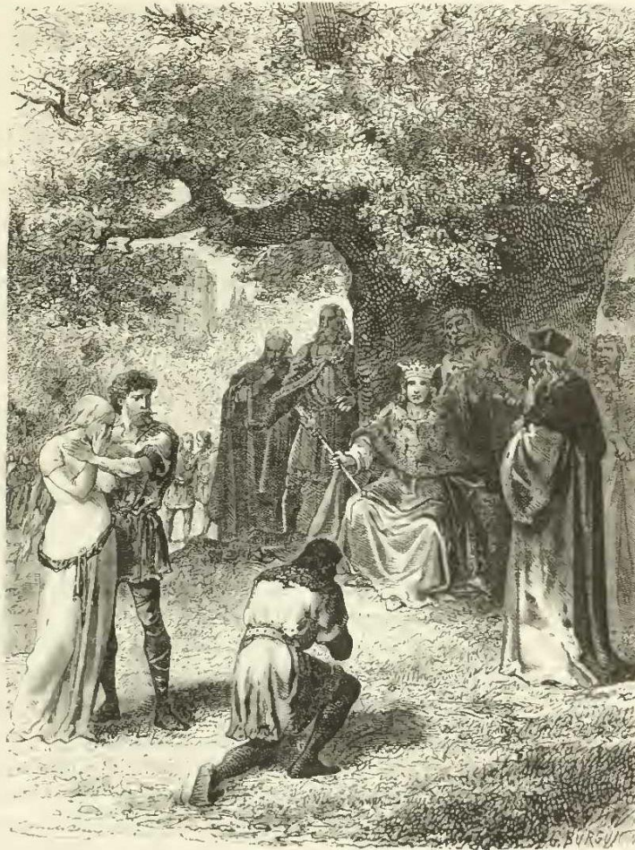
Saint Louis rendant la justice.

qu'il t'a plu, et qui maintenant viens de la retirer à toi selon ton bon plaisir! »