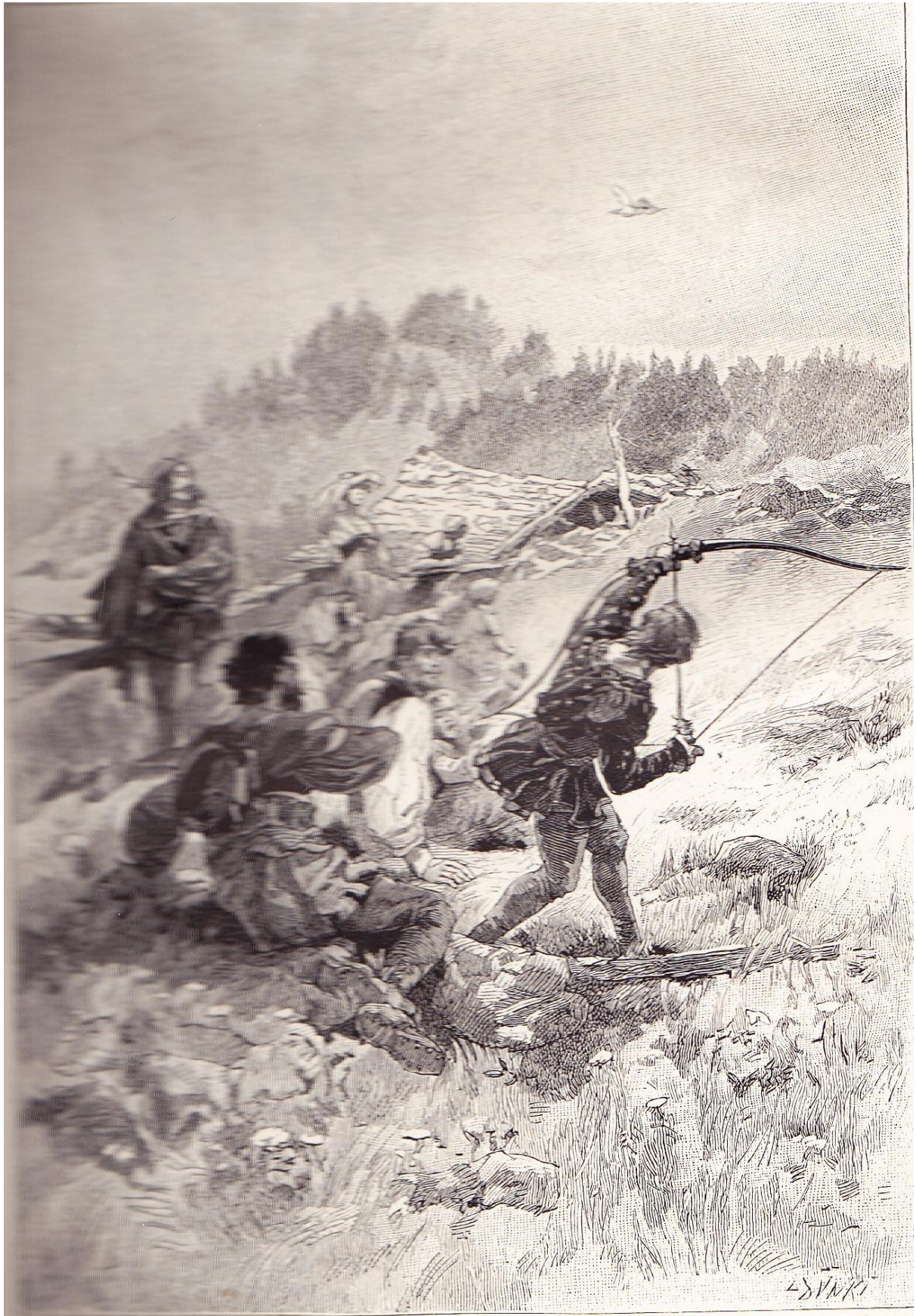
Le tir de l'arc.