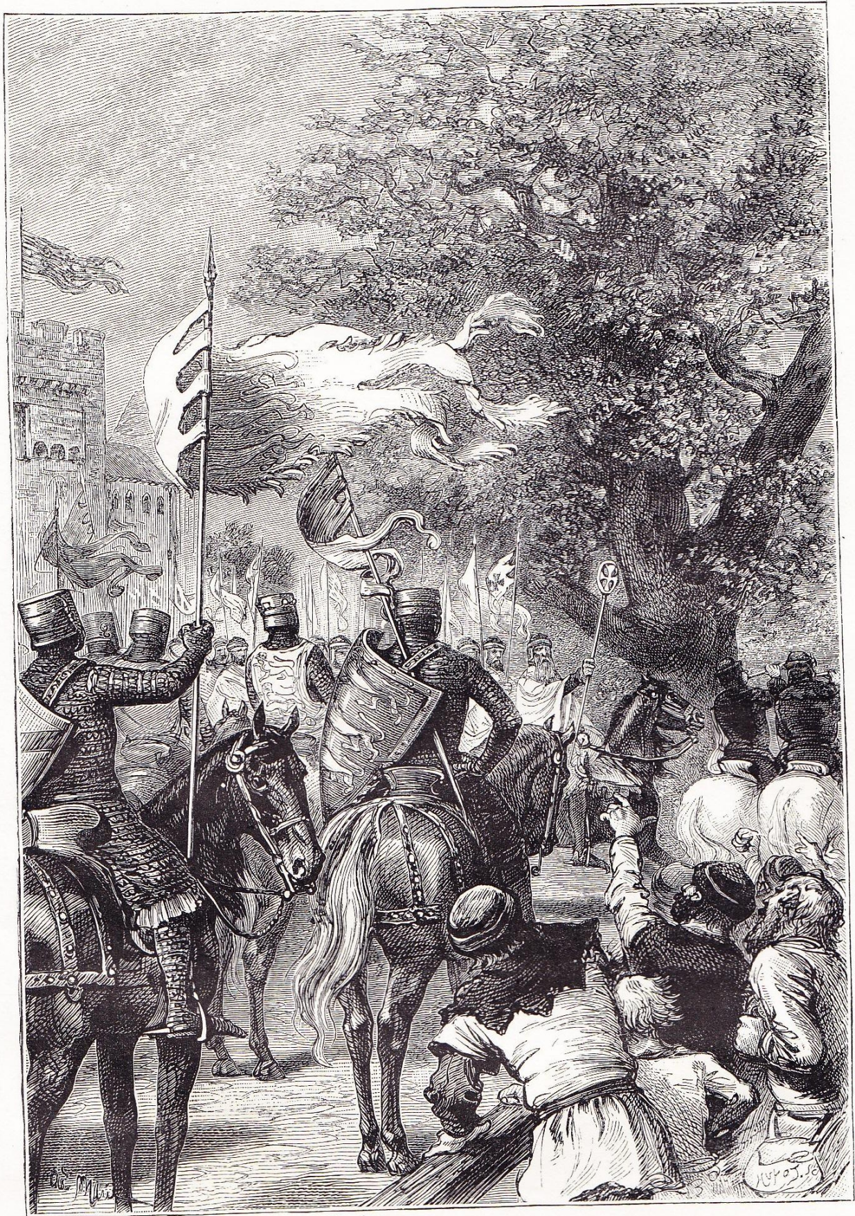
Départ des Templiers en présence du roi Richard Cœur de Lion.